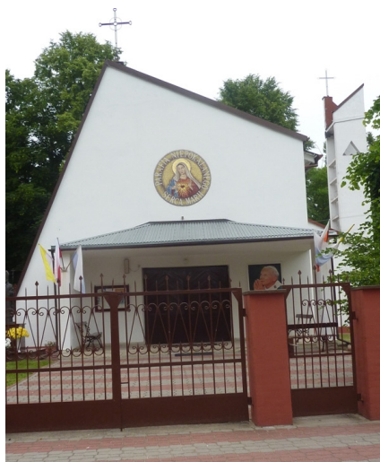
Zdjęcie nr 18: Kaplica w miejscowości Machory

Machory są wsią położoną nad Czarną posiadającą bogate tradycje przemysłowe. Jej nazwa należy do rodowych, które pierwotnie oznaczały członków jednego rodu. W 1510r. wymieniona jest kuźnia wodna, w drugiej połowie XVIII wieku wielki piec, w XIX wieku kopalnia rudy żelaza. Wielki piec czynny był do 1880r. Obecnie można zobaczyć