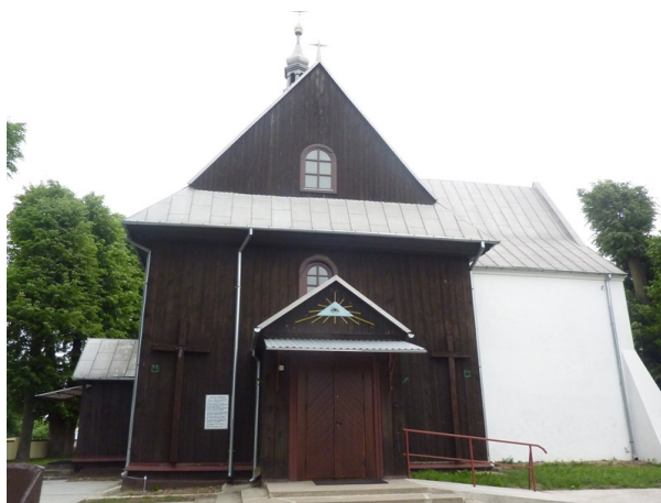
Zdjęcie nr 16: Drewniany kościół w Lipie

Kościół parafialny św. Wawrzyńca w Lipie usytuowany jest w centralnej części wsi. Pierwszy kościół modrzewiowy wybudowano już w roku 1129. Około roku 1636 dziedzic Bartłomiej Ruszeński i pleban Wawrzyniec Tadaiewa Tadajewski dobudowali do drewnianego Kościoła murowaną kaplicę Matki Boskiej Różańcowej. Ksiądz Wiśniewski