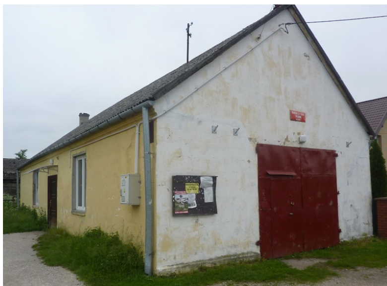
Zdjęcie nr 33: Remiza OSP w Dębnie.

OSP posiada lekki samochód Ford Transit, pompę pływakową. Podczas spotkania ze Stowarzyszeniami członkowie OSP wskazywali na braki w postaci pomp szlamowych, pływających.