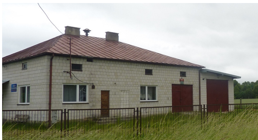
Zdjęcie nr 31: Remiza OSP w Wyszynie Falkowskiej.

Jednostka licząca 26 osób została założona w 1953r. i stanowi ona punkt alarmowania. Prezesem OSP jest Adam Tasak. W ostatnim czasie w budynku remizy OSP przeprowadzono prace remontowe przy garażu i adaptację małego garażu na pomieszczenie socjalne. Jednostka posiada samochód bojowy, hełmy strażackie – 6 szt.