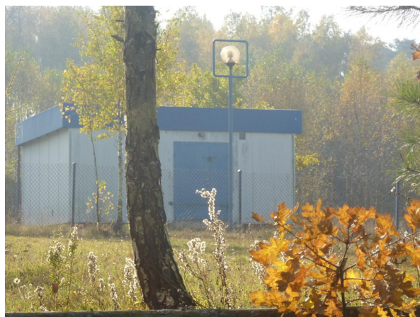
Zdjęcie nr 24: Nieczynne ujęcie wody w Szkucinie, własność Urzędu Gminy.