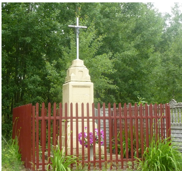
Zdjęcie nr 25: Krzyże przydrożne na terenie Gminy Ruda Maleniecka.

Na terenie Gminy Ruda Maleniecka znajduje się wiele krzyży i kapliczek przydrożnych. Stanowią one bezcenne bogactwo krajobrazu. Niektóre z nich stoją na uboczu, zapomniane przez ludzi, inne toną w kwiatach i są miejscem spotkań okolicznych mieszkańców. Stawiano je z różnych powodów i w różnych czasach. Żaden z nich nie powstał przypadkowo, każdy do czegoś nawołuje, przypomina o jakimś zdarzeniu.