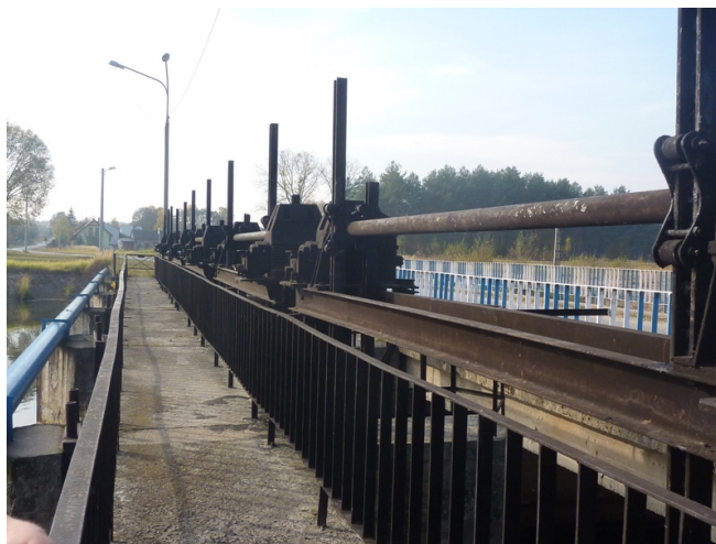
Na zdjęciu nr 13: Urządzenia melioracyjne w Cieklińsku – własność Gminy Ruda Maleniecka.

W okolicach Cieklińska występują torfy związane z torfowiskami dolinnymi powstałymi w Dolinie Czarnej Koneckiej i jej dopływów. Są to torfiska niskie, złożone z torfów trzcinowych i drzewnych. Torfy pochodzą z czwartorzędu i nie są eksploatowane.