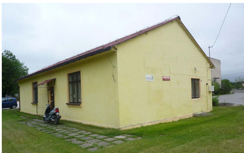
Zdjęcie nr 44: Gminna Biblioteka Publiczna w Rudzie Malenieckiej

Księgozbiór w miarę możliwości jest uzupełniany o nowe pozycje - w 2010r. zakupiono 533 książki. Czytelnicy Biblioteki mają również możliwość skorzystania z Internetu.