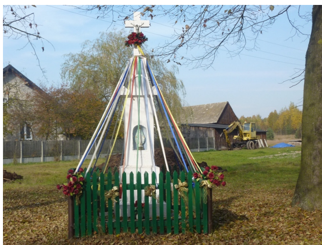
Zdjęcie nr 15: Kapliczka zlokalizowana w miejscowości Hucisko.