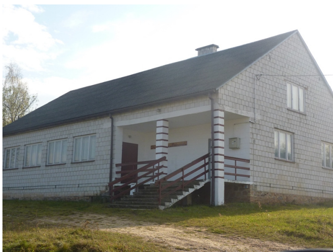
Zdjęcie nr 23: Szkucin – Dom Ludowy.

Warto zobaczyć także odsłonięcie geologiczne w centrum wsi, na wzgórzu za sklepem. Powstało w miejscu wyrobiska żwiru, nazwane jest Gajem. Znajdujące się tam zlepionce skalne są znacznie słabiej „zlepione” niż te w Piekielku. Żwir łatwo „odkleja się” i obsuwa, woda rzeźbi w nich szczeliny i rowy. Na szczycie tego żwirowego wzgórza znajduje się drewniany krzyż, oraz pomnik ku pamięci Papieża Jana Pawła II.