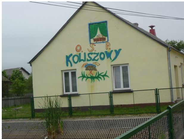
Zdjęcie nr 29: Remiza OSP Koliszowy.