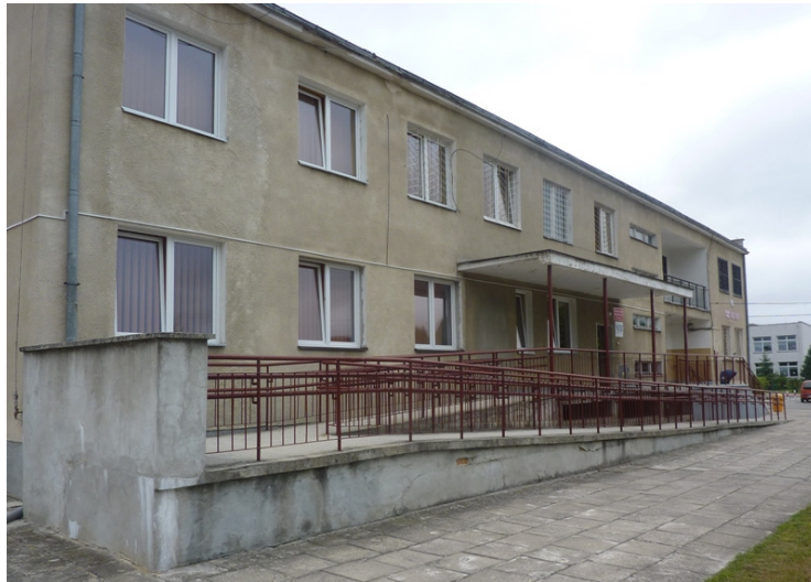
Zdjęcie nr 26: Publiczny Zakład Opieki Zdrowotnej w Rudzie Malenieckiej

Na terenie Gminy funkcjonuje jeden Publiczny Zakład Opieki Zdrowotnej w Rudzie Malenieckiej.