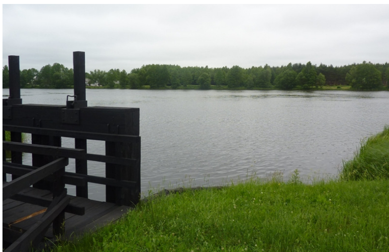
Zdjęcie nr 9: Staw z zaporą w miejscowości Maleniec

Na terenie Gminy zlokalizowanych jest szereg stawów rybnych. Aktualnie kilka gospodarstw prowadzi hodowlę ryb w stawach o łącznej powierzchni 315 ha. Gospodarstwa rybackie oprócz karpia wprowadziły do hodowli takie gatunki jak: szczupak, sandacz, sum, jaź, lin, karaś.