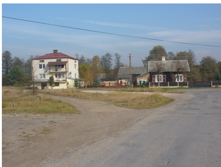
Zdjęcie nr 12: Skwer w miejscowości Cieklińsko, własność Gminy Ruda Maleniecka. W niewielkiej odległości od skweru jest budowany dom ludowy.

W miejscowości Cieklińsko obok skweru budowany jest obecnie Wiejski Dom Ludowy – zlokalizowany na działce nr 807/7 o powierzchni użytkowej 155m 2 . Sołectwo to jest położone wśród pięknych, atrakcyjnych turystycznie rozlewisk rzeki Czarnej Koneckiej. Korzystnymi elementami dla rozwoju szeroko rozumianej turystyki są zasoby leśne oraz czyste ekologicznie wody.