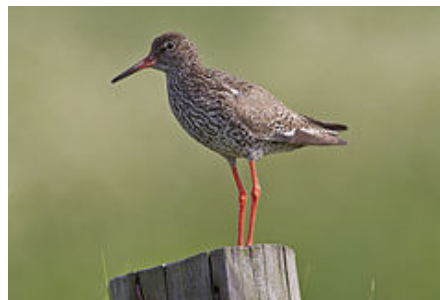
Zdjęcie nr 10: Rycyka oraz krwawo dziób - rzadkie gatunki ptaków występujące na terenie Gminy Ruda Maleniecka

Okoliczne zbiorniki wodne cechuje duża różnorodność form życia. Mają tu swoje siedliska wydry oraz bobry z mozołem budujące żeremia. Środowisko naturalne w Gminie nie ma oznak dużej degradacji o czym świadczy duża liczba ptactwa chronionego: