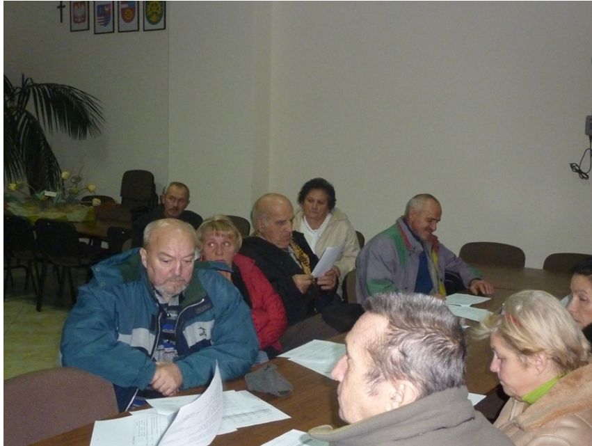
Zdjęcie nr 6: Spotkanie w sprawie Strategii w miejscowości Maleniec w dniu 23.11.2011r.