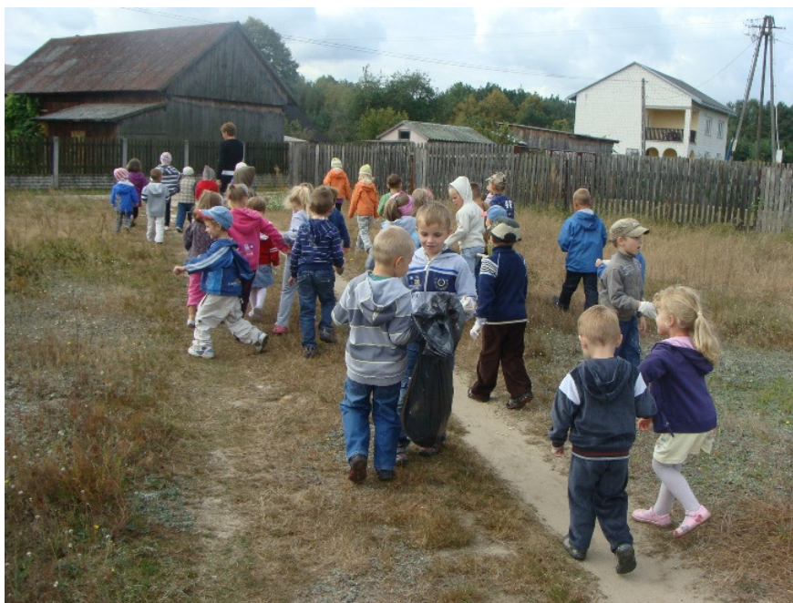
Zdjęcie nr 40: Sprzątanie świata