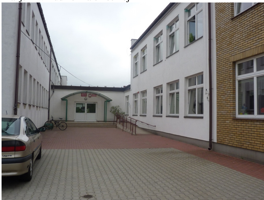
Zdjęcie nr 34: Publiczne Gimnazjum w Rudzie Malenieckiej

Gimnazjum w Rudzie Malenieckiej działa od 1 września 1999r. Szkoła pracuje w bardzo dobrych warunkach. W budynku znajduje się 8 sal lekcyjnych. W roku szkolnym 2009/2010 w sześciu oddziałach uczyło się 100 uczniów z terenu całej Gminy.