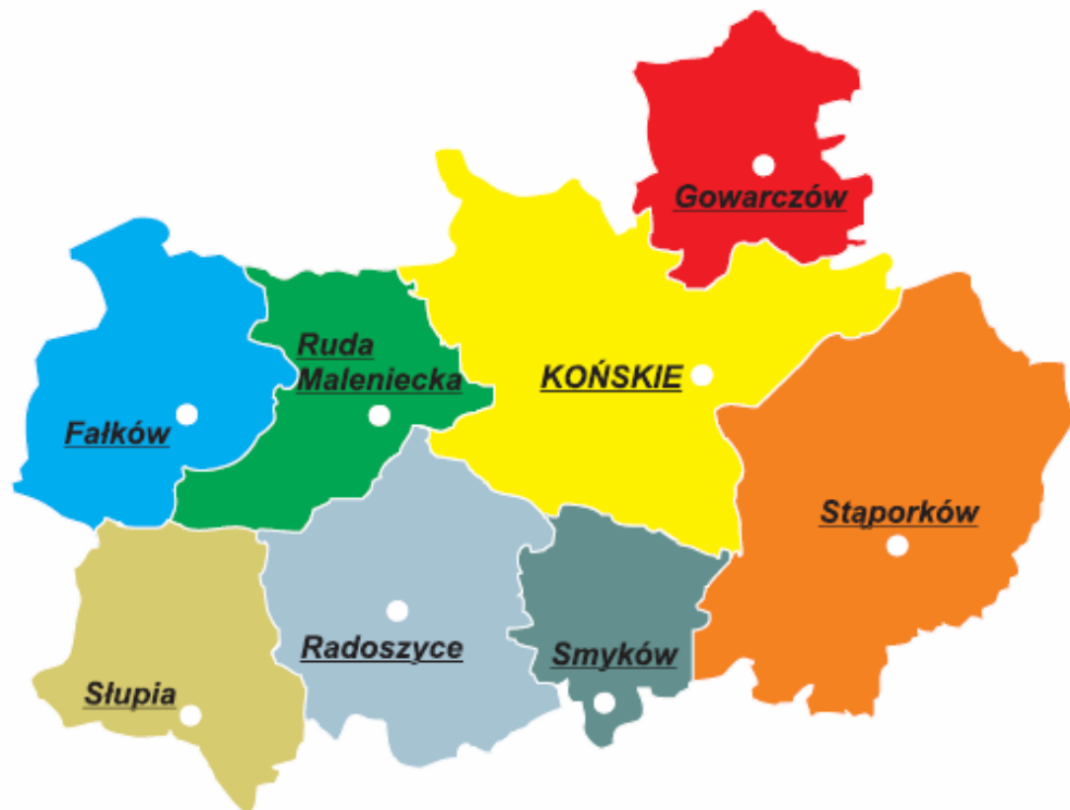
Mapa nr 1 - Gmina Ruda Maleniecka na tle Powiatu Koneckiego.

Gmina Ruda Maleniecka usytuowana jest w północno – zachodniej części województwa świętokrzyskiego. Jej tereny rozciągają się na krańcach najstarszych w Europie Gór Świętokrzyskich. Zgodnie z podziałem fizyczno – geograficznym znajduje się w obrębie makroregionu Wyżyny Kielecko – Sandomierskiej i Wyżyny Przedborskiej. Administracyjnie stanowi jedną z ośmiu gmin powiatu koneckiego zlokalizowaną w jego północno – zachodniej części. Graniczy od północy z gminą Żarnów (powiat opoczyński, województwo łódzkie), od północnego - wschodu z gminą Końskie, od zachodu z gminą Falków, zaś od południa sąsiaduje z gminami: Radoszyce oraz Słupia Konecka. Przez teren gminy przepływa rzeka Czarna Konecka – prawy dopływ Pilicy.