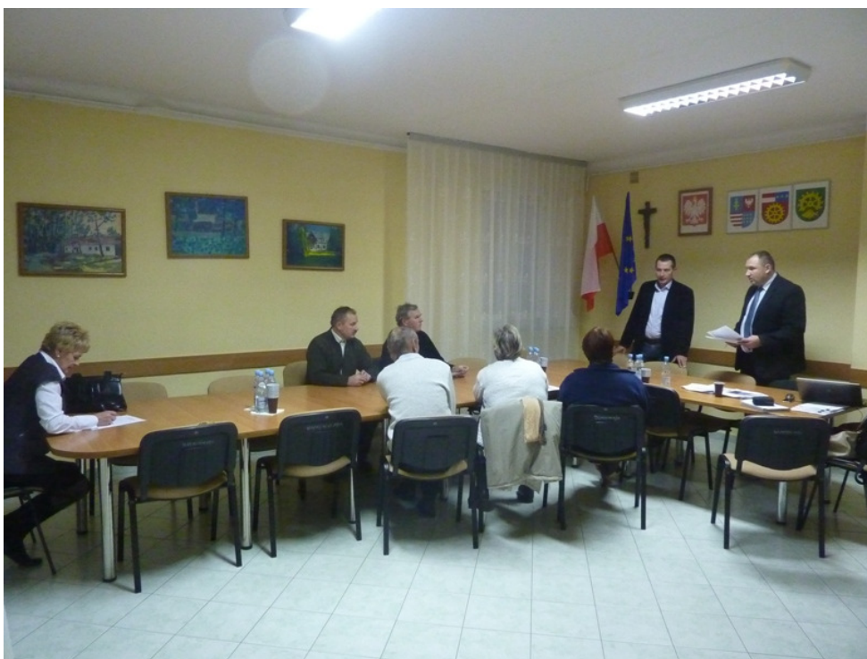
Zdjęcie nr: 5: Spotkanie dot. rozwoju sołectw w miejscowości Ruda Maleniecka 22.11.2011 r.