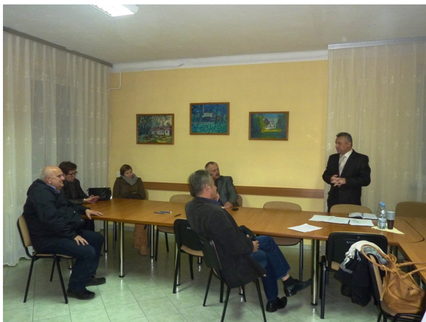
Zdjęcie nr 1: Spotkanie strategiczne z przedsiębiorcami - 07.11.2011r.