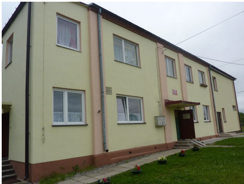
Zdjęcie nr 38: Publiczne Przedszkole w Rudzie Malenieckiej

Przedszkole w Rudzie Malenieckiej mieści się w budynku z lat 80-tych XX-wieku. W styczniu 2011 roku dzięki projektowi „Świat Malucha” współfinansowanego przez Unię Europejską w ramach Europejskiego Funduszu Społecznego utworzono dodatkowy oddział przedszkolny. Liczba dzieci wzrosła z 24 do 48. W budynku miesi się również oddział „0”, do którego uczęszcza 12 sześciolatków. Placówka posiada trzy sale do prowadzenia zajęć. Budynek wyposażony jest w szatnię, łazienki oraz kuchnię. Dzieci mogą korzystać z placu zabaw umiejscowionego tuż obok budynku przedszkola oraz ogólnodostępnego placu oddanego do użytku w 2011r. sfinansowanego z tzw. małej odnowy wsi – konkursu Urzędu Marszałkowskiego Województwa Świętokrzyskiego.