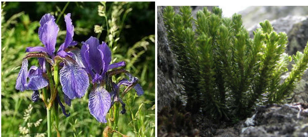
Zdjęcie nr 11: Kosaciec syberyjski i widłak wroniec – roślinność występująca na terenie Gminy Ruda Maleniecka.

Świat roślinny reprezentowany jest tutaj przez takie rzadkie gatunki jak między innymi: wawrzynek wilczełyko, widłak wroniec czy kosaciec syberyjski. Na stawach i podmokłych łąkach można także spotkać: przebiśniegi, bluszcz pospolity, konwalie, rzeżuchę, fiołek błotny, rosiczki, storczyk plamisty, jaskier wielki. Z innych przedstawicieli flory można spotkać: modrzewie, storczyk plamisty, pokrzyk wilcza jagoda, zawilec gajowy, przylaszczka, kopytnik, bluszcz leśny, widłak, borówka brusznica, konwalia majowa, kokoryczka wielokwiatowa, podbiał, jodła pospolita.