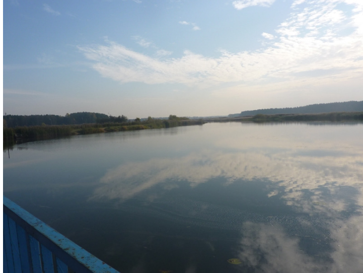
Zdjęcie nr 22: Zbiornik wodny w miejscowości Ruda Maleniecka. Fot. Pro-Inspiracja.pl

W układzie przestrzennym miejscowości Ruda Maleniecka jest widoczny wpływ uwarunkowań historycznych – dużą rolę w przeszłości odgrywał tzw. „kasztelański gościniec”, czyli droga z Miedzierzy do Maleńca, którą transportowano surowiec do okolicznych fabryk. Najważniejsze instytucje były umieszczone przy tymże gościńcu: dwór, kaplica, młyn, kantor, karczma, czworaki, tartak, remiza, kuźnie, ochronka, stacja rybacka. Dziś „kasztelański gościniec” to droga krajowa. Wiele dawnych zabudowań wciąż istnieje, ale powstały także nowe – Szkoła, kościół, budynek Urzędu Gminy i Ośrodka Zdrowie, restauracja, sklepy. W miejscowości nie ma rynku, ani dużego placu pełniącego tego typu funkcje. Ruda Maleniecka dzieli się na przysiółki zwyczajowo zwane: Doświadczalnia, Lipianka, Piaski, Praga, Dwór, Kantor, Chojna, Czapla, Wielki Las.