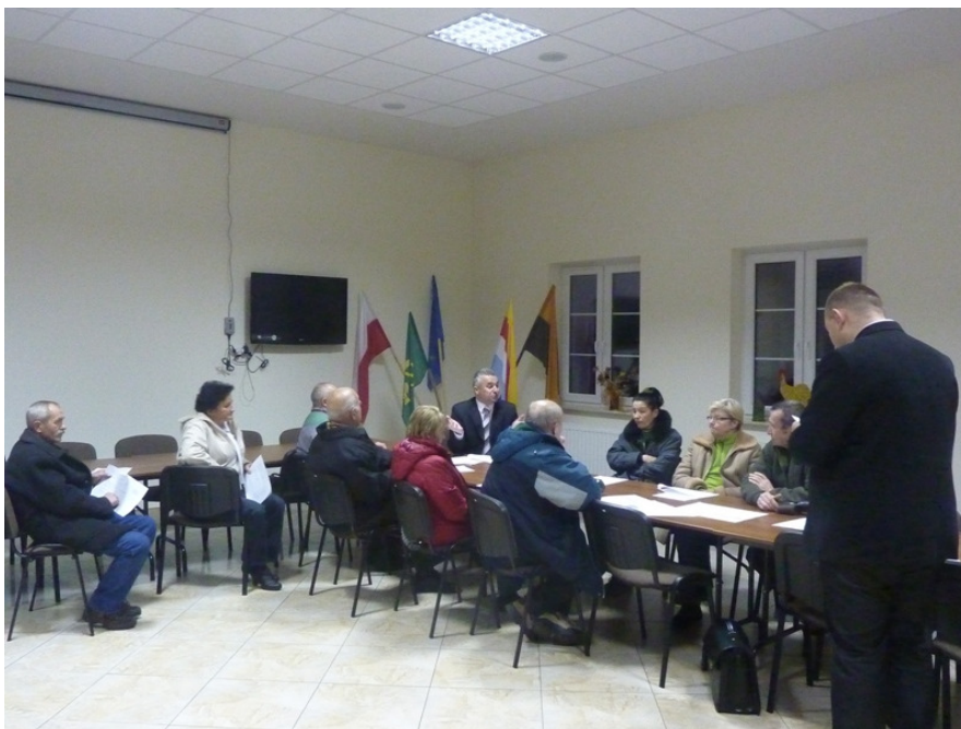
Zdjęcie nr 7: Spotkanie w sprawie Strategii w miejscowości Maleniec w dniu 23.11.2011r.

Na zadawane pytanie podczas zebrań z mieszkańcami z czym kojarzy się Gmina Ruda Maleniecka w ich opinii – padały odpowiedzi: