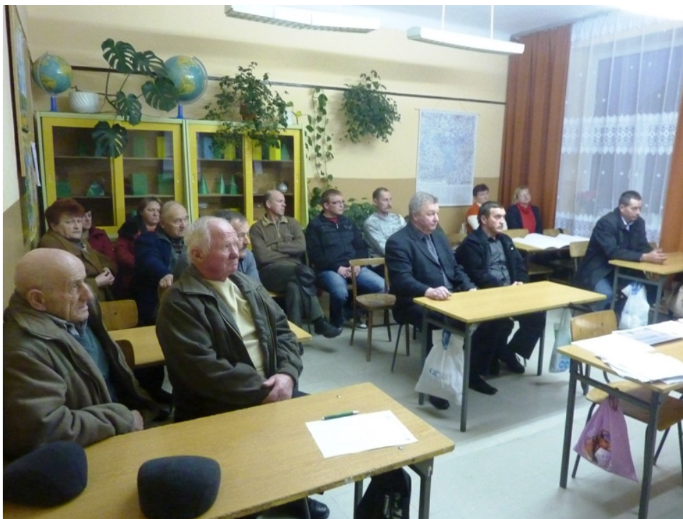
Zdjęcie nr 4: Spotkanie w sprawie Strategii w miejscowości Lipa 21.11.2011r.