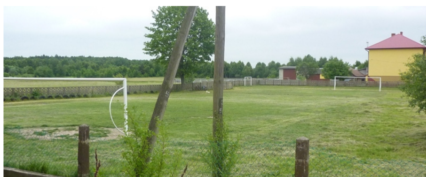
Zdjęcie nr 43: Boisko szkolne w Lipie

Na terenie gminy znajduje się wiele miejsc nadających się na rekreację i wypoczynek np. terenu wokół remiz strażackich czy świetlic, a także wiejskie boiska sportowe - po odpowiednim ich zagospodarowaniu i zapewnieniu bezpieczeństwa mogą stać się miejscem wypoczynku nie tylko mieszkańców, ale również turystów odwiedzających Gminę. Samorząd stara się pozyskiwać środki finansowe na remont i modernizację boisk składając wnioski i uzyskując dotacje np. z Lokalnej Grupy Działania czy też z Lokalnej Grupy Rybackiej.