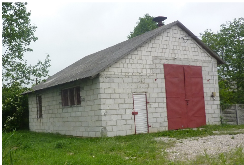
Zdjęcie nr 32: Remiza OSP w Młotkowicach.

OSP Młotkowice posiada samochód lekki Volkswagen T4, pompy pływakowe oraz elementy umundurowania: ubrania lekkie, hełmy, buty.