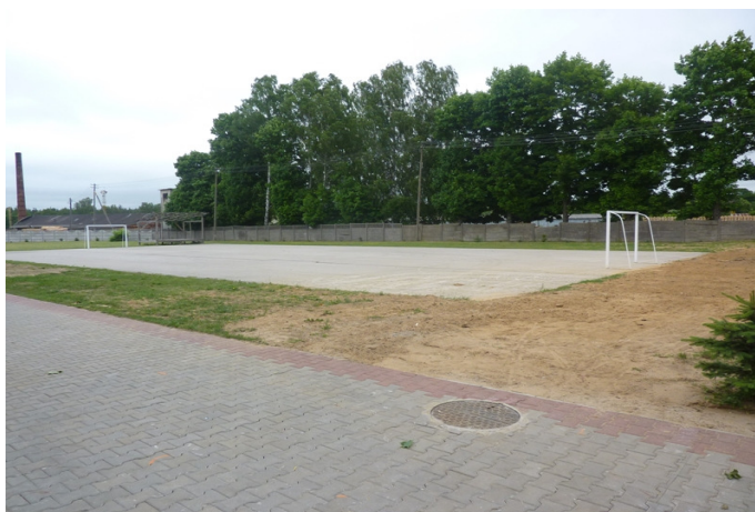
Zdjęcie nr 42: Boisko szkolne w Rudzie Malenieckiej