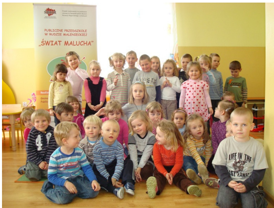
Zdjęcie nr 39: Przedszkolaki 2011/2012

w kuchni przedszkola. 48 dzieci korzysta ze śniadania, obiadu składającego się z dwóch dań i podwieczorku. Natomiast dla 12 przygotowywane są obiady odpłatne. Placówka opiekuje się dziećmi w dni powszednie w godzinach 7:00-16:00.