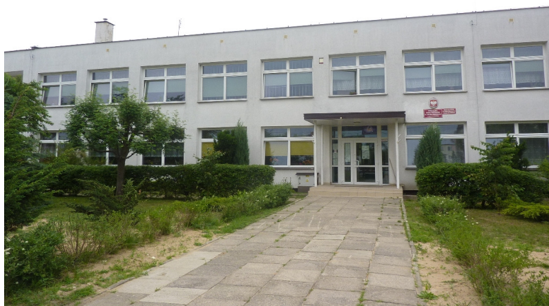
Zdjęcie nr 35: Publiczna Szkoła Podstawowa w Rudzie Malenieckiej