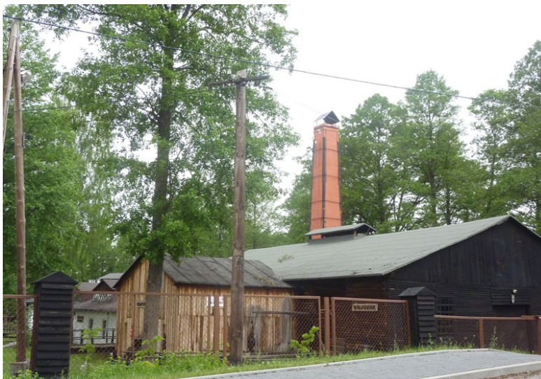
Zdjęcie nr 19. Zabytkowy Zespół Walcowni i Gwoździarni w Maleńcu

Jest to wieś położona przy starej szosie Łódź-Kielce nad rzeką Czarną Konecką, która była kiedyś źródłem energii dla wybudowanych dawniej nad jej brzegami zakładów przemysłowych. W Maleńcu znajduje się Muzeum Techniki stanowiące zespół walcowni i gwoździarni, na miejscu kuźni z XVI-XVIII wieku. W skład zespołu wchodzi: szpadlarnia, walcownia, klatka koła wodnego, magazyn i układ wodny. Jest to unikalny obiekt w skali światowej, który zachował się bez prób unowocześniania od 1874 roku.