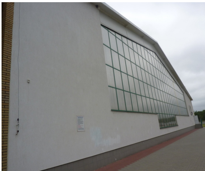
Zdjęcie nr 41: Hala sportowa przy Publicznym Gimnazjum w Rudzie Malenieckiej

W Rudzie Malenieckiej przy gimnazjum znajduje się hala sportowa z której mogą korzystać dzieci i młodzież. Do dyspozycji są również boiska przy szkołach np. Ruda Maleniecka, Lipa oraz w miejscowościach, które dysponują wolnym placem na tego typu miejsce aktywności i rekreacji np. Kołoniec.