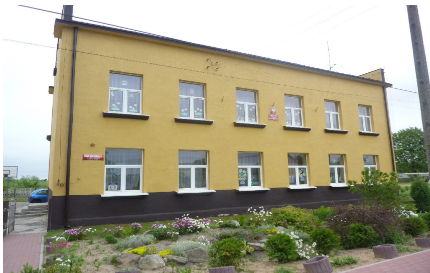
Zdjęcie nr 37: Publiczna Szkoła Podstawowa w Rudzie Malenieckiej – Szkoła Filialna w Lipie

W roku szkolnym 2011/2012 do placówek oświatowych na terenie Gminy uczęszcza 342 uczniów, w tym 68 dzieci to wychowankowie przedszkola i oddziałów zerowych. W oddziałach szkół podstawowych uczy się 178 dzieci natomiast w gimnazjum 96 uczniów.