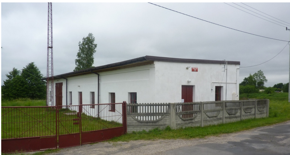
Zdjęcie nr 30: Remiza OSP w Kołońcu.