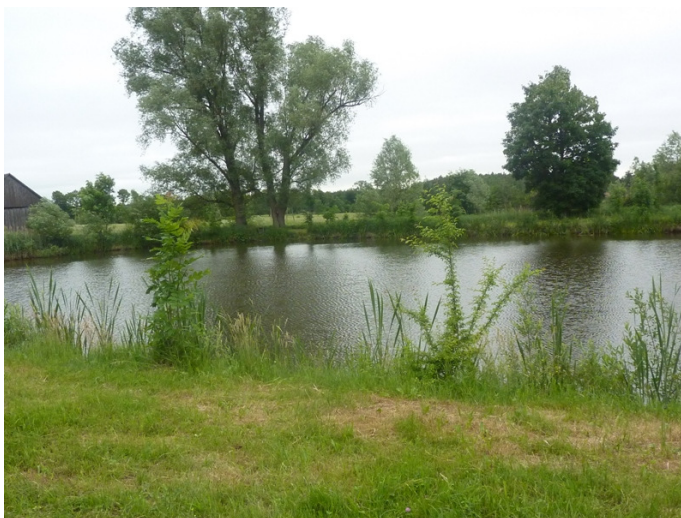
Zdjęcie nr 8. Staw w miejscowości Dęba Kolonia

Przez obszar gminy przepływa rzeka Czarna Konecka (klasa czystości II) – prawy odpływ Pilicy, wokół której powstało wiele zbiorników wodnych, głównie stawów, w których prowadzona jest hodowla ryb. Obszar gminy cechuje się dużą gęstością sieci rzecznej w postaci licznych cieków wodnych.