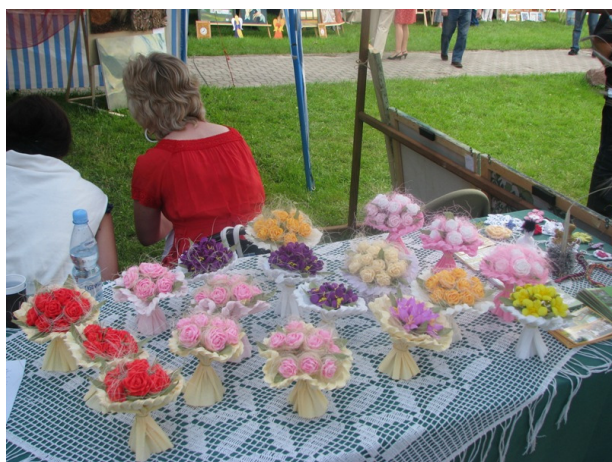
Zdjęcie nr 27: Stowarzyszenie „Lipianki” często prezentuje swoje prace na imprezach gminnych i powiatowych. Na zdjęciu kwiaty z krepiny.