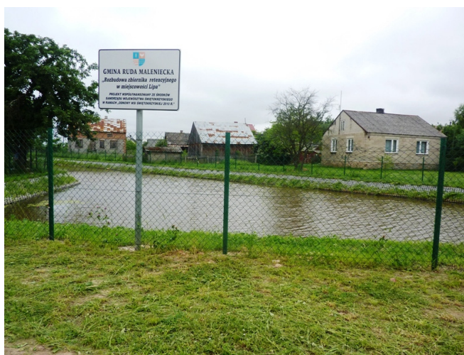
Zdjęcie nr 17: Zbiornik retencyjny w miejscowości Lipa.

Kościół ma konstrukcję zrębową z drewna modrzewiowego, wzmocnianą lisicami. Elewacje pokryte są szalunkami z desek na „styk”, zwieńczone gzymsem pod okapowym. Nad pokrytymi blachą dachami wznosi się smukła wieżyczka sygnaturki z arkadową latarnią, nakryta cebulastym hełmem.