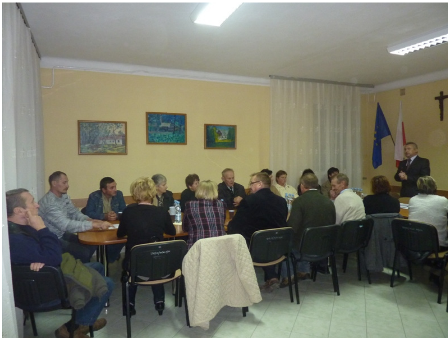
Zdjęcie nr 2: Spotkanie strategiczne z sołtysami i radnymi w sprawie Strategii w dniu 09.11.2011r.