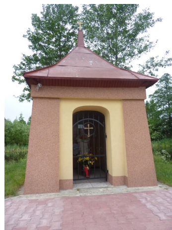
Zdjęcie nr 20: Odnowiona w 2010r. kapliczka św. Jana zlokalizowana w miejscowości Młotkowice. Fot. Pro-Inspiracja.pl

Zdjęcie nr 21: Dom Ludowy w Młotkowicach wyremontowany z Programu Rozwoju Obszarów Wiejskich – działanie „Odnowa i rozwój wsi”. Fot. Pro-Inspiracja.pl